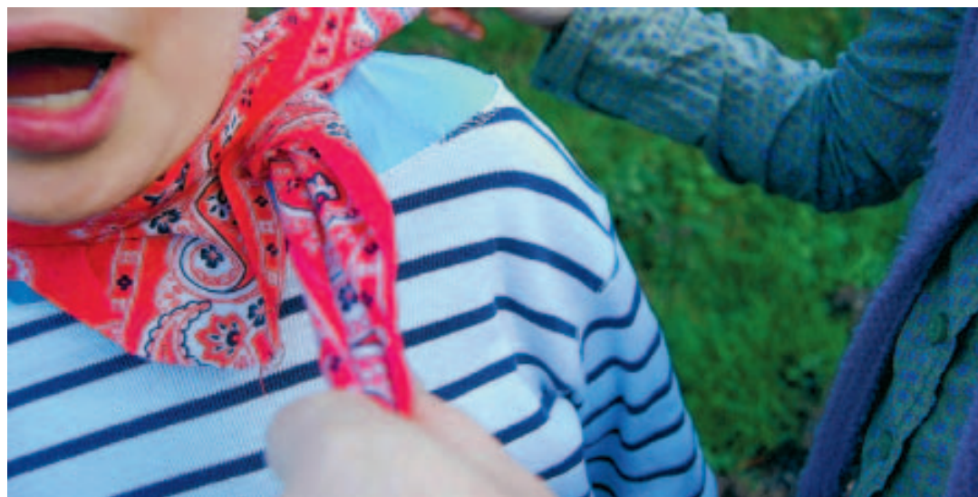
La recherche de sensations inédites motive les jeunes à tester ces jeux de l'extrême. ■ E.R.

Car tout ce qui comporte le mot "jeu" attire inexorablement les enfants et les ados, illustrent les trois administratrices belges de cette page à laquelle 311 personnes ont déjà adhéré.