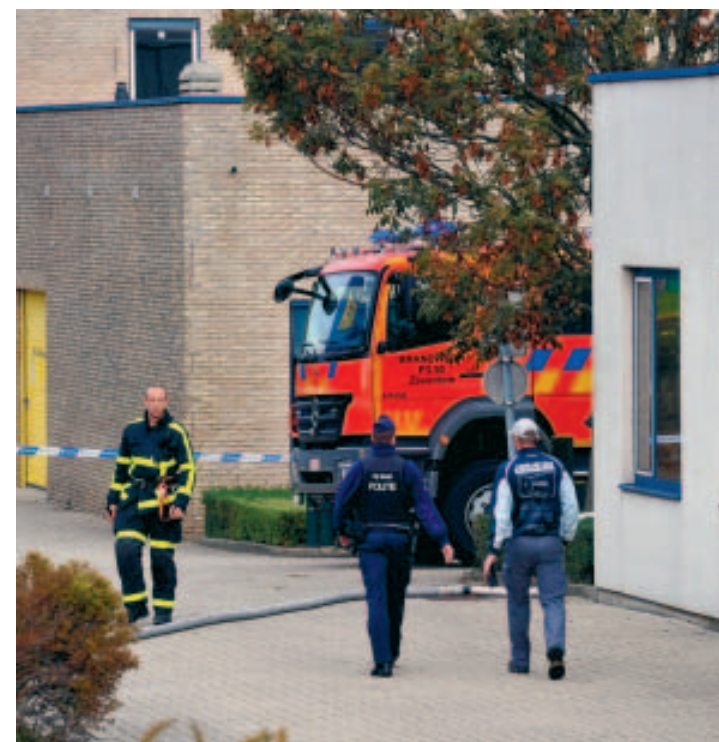
B. La fuite a été rapidement maîtrisée. ■ LAURENT LANGE

L'opération a nécessité le renfort des pompiers de Bruxelles et de Louvain. «